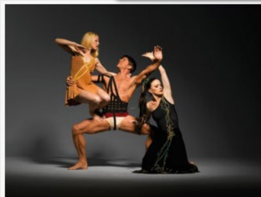
Martha Graham Dance Company

Mnoštvo je zanimljivih izložbi koje će vas osvojiti u bečki MuseumsQuartier, a evo nekih koje su nam se učinile najatraktivnijim.