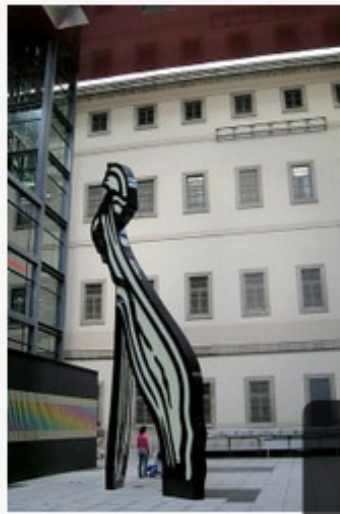
Skulptura Roya Lichtensteina

Već smo pisali o prošlogodišnjim izložbama radova Michelangela i Picassa u bečkoj Albertini koje su izazvale veliko zanimanje javnosti, a u ovom vam članku donosimo obavijesti o ovogodišnjem repertoaru pomenutog muzeja.